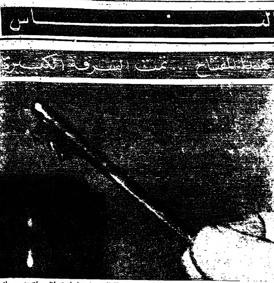
الفتح «المثل» الذي استعمل في فتح «الغزّة» خلال السراقة التي تمت في احدى المؤسسات بعمان واكتشفت مؤخرًا

لندن - رويتر - اذاع راديو لندن ان قسم الاذاعة العبرية سيتوقف عن البث من هبة الاذاعة البريطانية لان عدداً كبيراً من سكان اسرائيل يستطيعون الاستماع الى الاذاعة باللغة الانجليزية ولم يعرف متى سيتوقف هذا القسم .